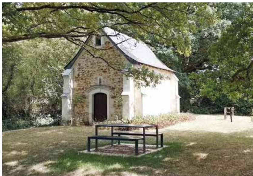
La chapelle La Touche aux ânes

Reste à Angers Loire Métropole à rafraîchir et actualiser, dans les prochaines semaines, les panneaux situés sur le parking de Galilée et à La Coudre.