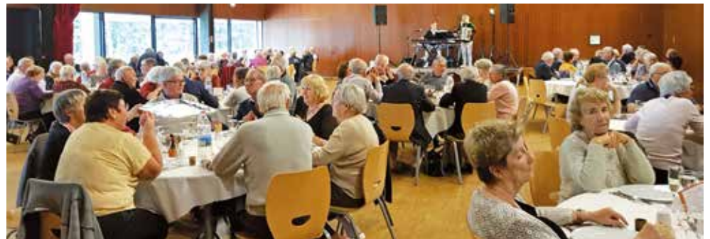
Repas des aînés