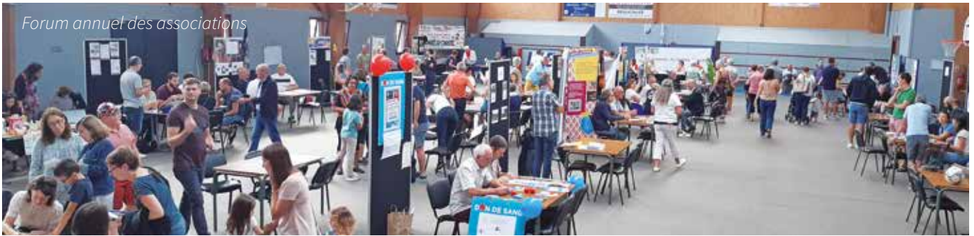
Forum annuel des associations