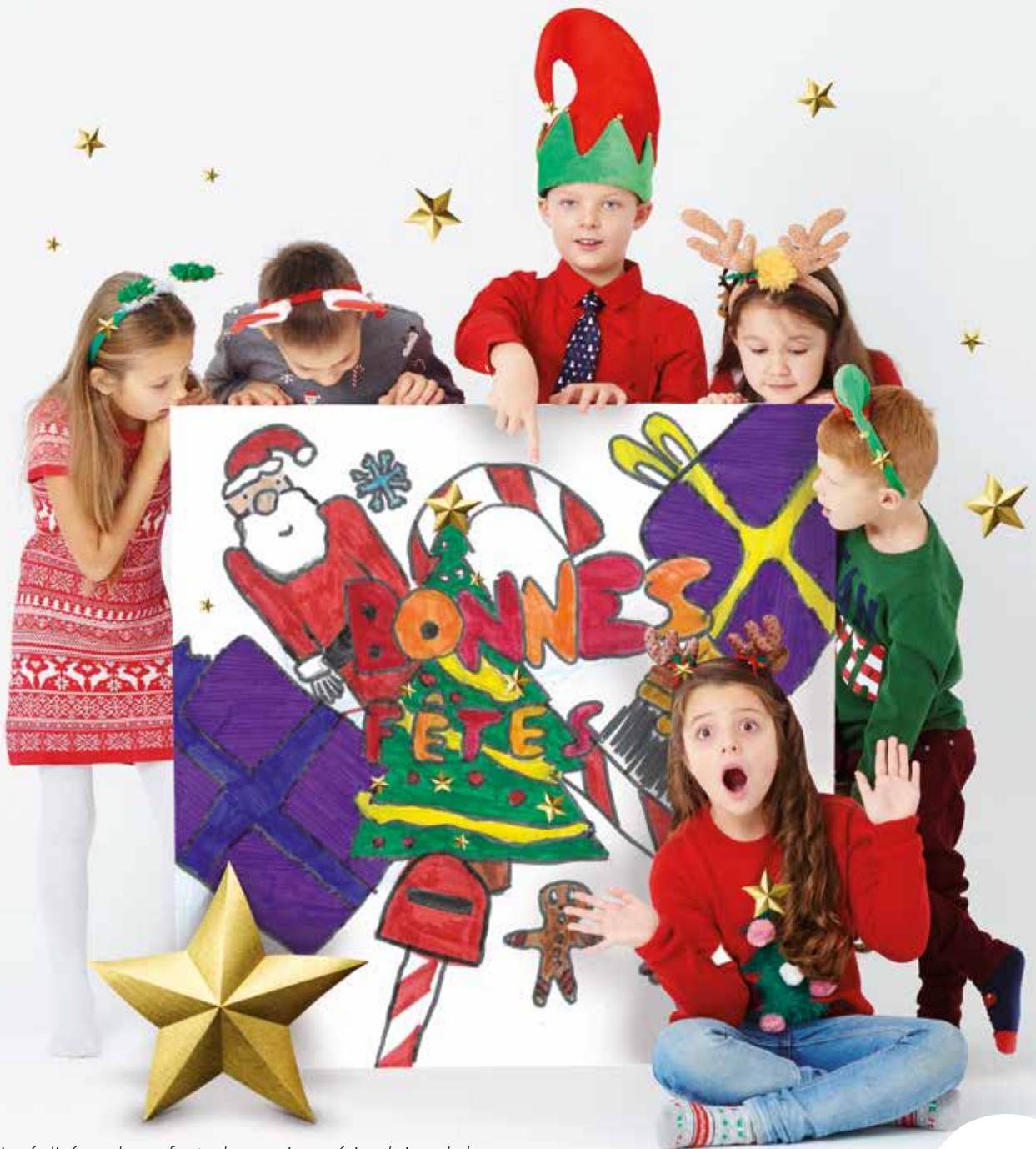
Dessin réalisé par les enfants des services périscolaires de la commune