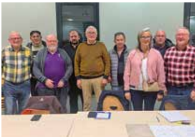
Bureau 2023/2024 suite AG

Nos entraînements ont lieu à la salle multiactivités (Les hauts Champs-Saint-Jean-de-Linières) les lundis et jeudis à partir de 14h, et les mercredis et vendredis à partir de 20h.