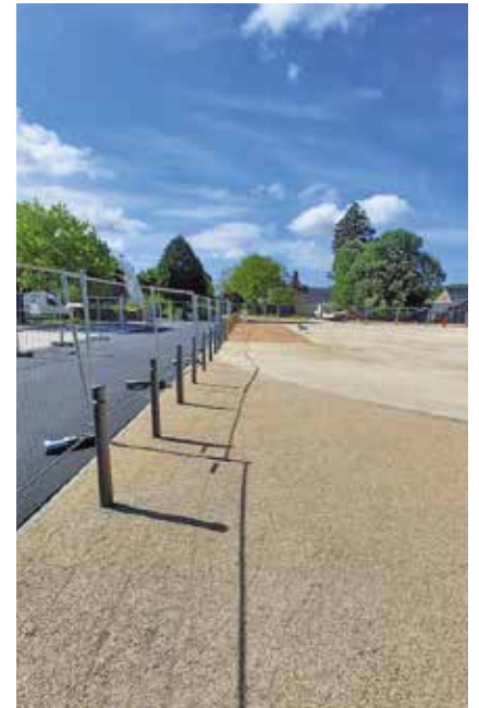
Des potelets installés place de la Croisée.