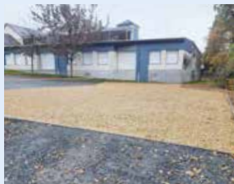
7 places parking supplémentaires