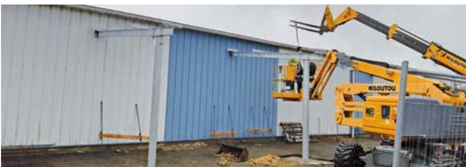
Le centre technique municipal en travaux.