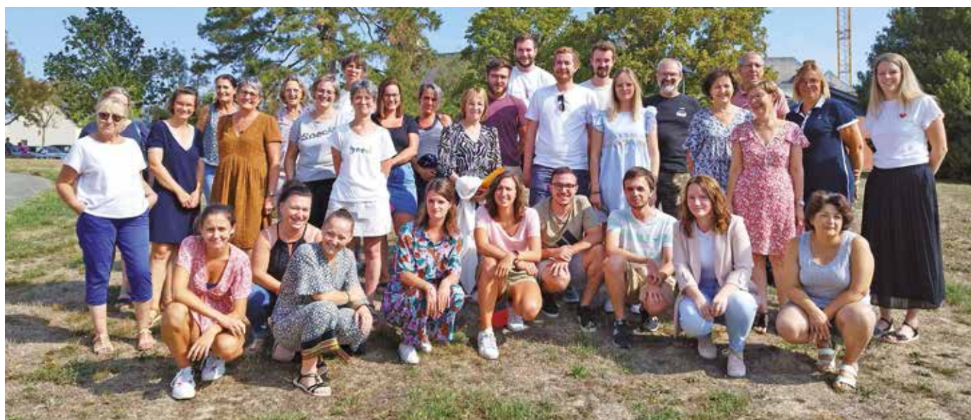
Ensemble du personnel des services périscolaires : animation, restauration et entretien