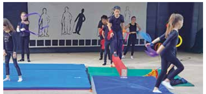
Fête des écoles : élèves de Claude Debussy