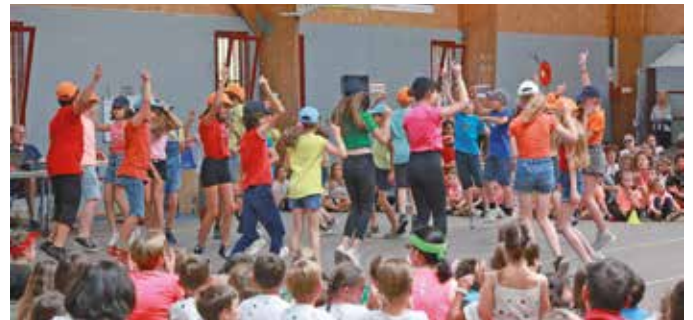
Fête des écoles : élèves des Grands Chênes