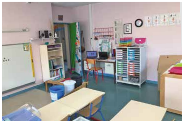
Travaux dans les classes : De gauche à droite : classe des Grands Chênes et Claude Debussy