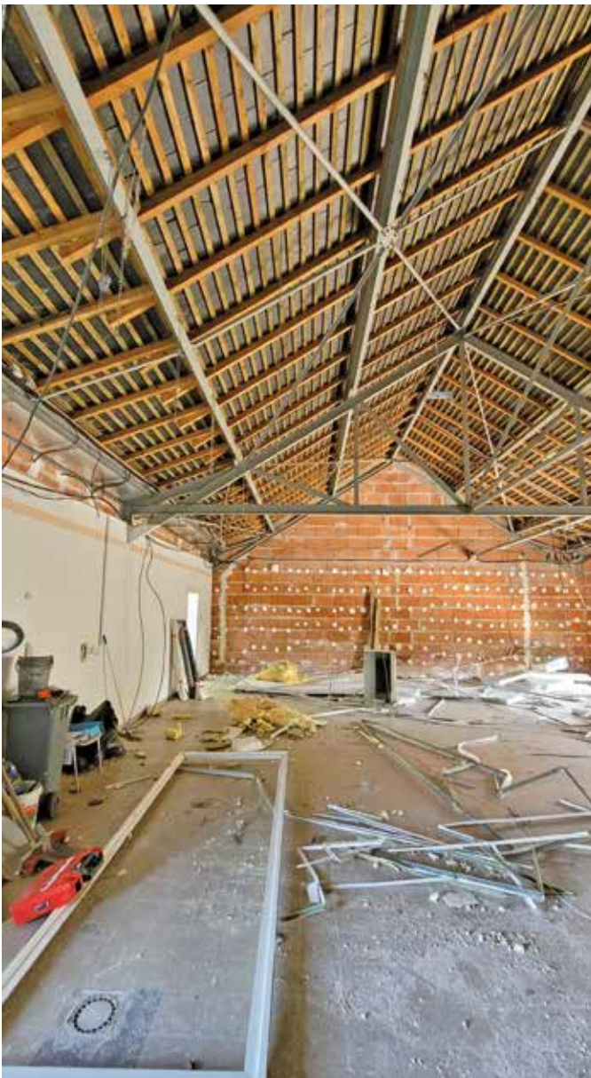
Future bibliothèque en travaux

Le local actuel de la bibliothèque deviendra en 2023 la maison des jeunes animée par le Centre Social Intercommunal l'Atelier.