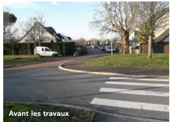
Avant les travaux

Ces travaux ayant pour finalité d'améliorer la circulation et la sécurité routière bénéficient de 51 000 euros de subvention provenant de la Région et d'une dotation des recettes des amendes de police.